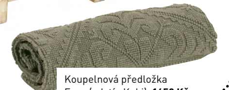
Koupelnová předložka Enzo (odstín Kaki), 1650 Kč