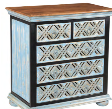
Komoda dřevo a kov, 17 200 Kč