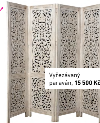
Výřezávaný paraván, 15 500 Kč