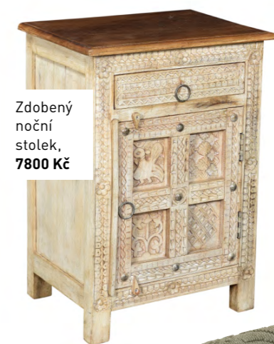
Zdobení noční stolek, 7800 Kč