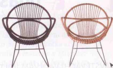
Ratanová židle Singapore, Polls Potten, 11 900 Kč