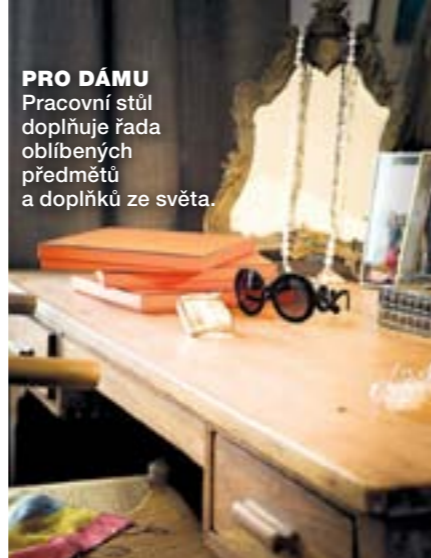
PRO DÁMU Pracovní stůl doplňuje řada oblíbených předmětů a doplňků ze světa.