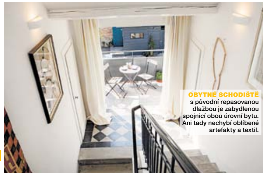
OBÝTNÉ SCHODIŠTĚ s původní repasovanou dlažbou je zabydlenou spojnicí obou úrovní bytu. Ani tady nechybí oblíbené artefakty a textil.

v kuchyni s jídelním koutem v horním patře bytu posloužila jako neutrální základ. Kuchyňský ostrůvek, stůl a židle od Mies van der Rohe se s majiteli stěhovaly z předchozího bytu v centru.