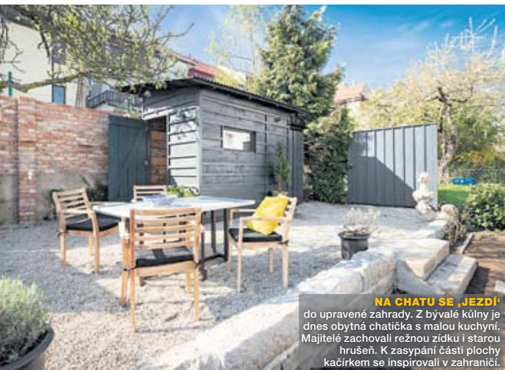
NA CHATU SE JEZDÍ do upravené zahrady. Z bývalé kůlny je dnes obytná chatička s malou kuchyní. Majitelé zachovali režnou zídku i starou hrušeň. K zasypání části plochy kačírkem se inspirovali v zahraničí.