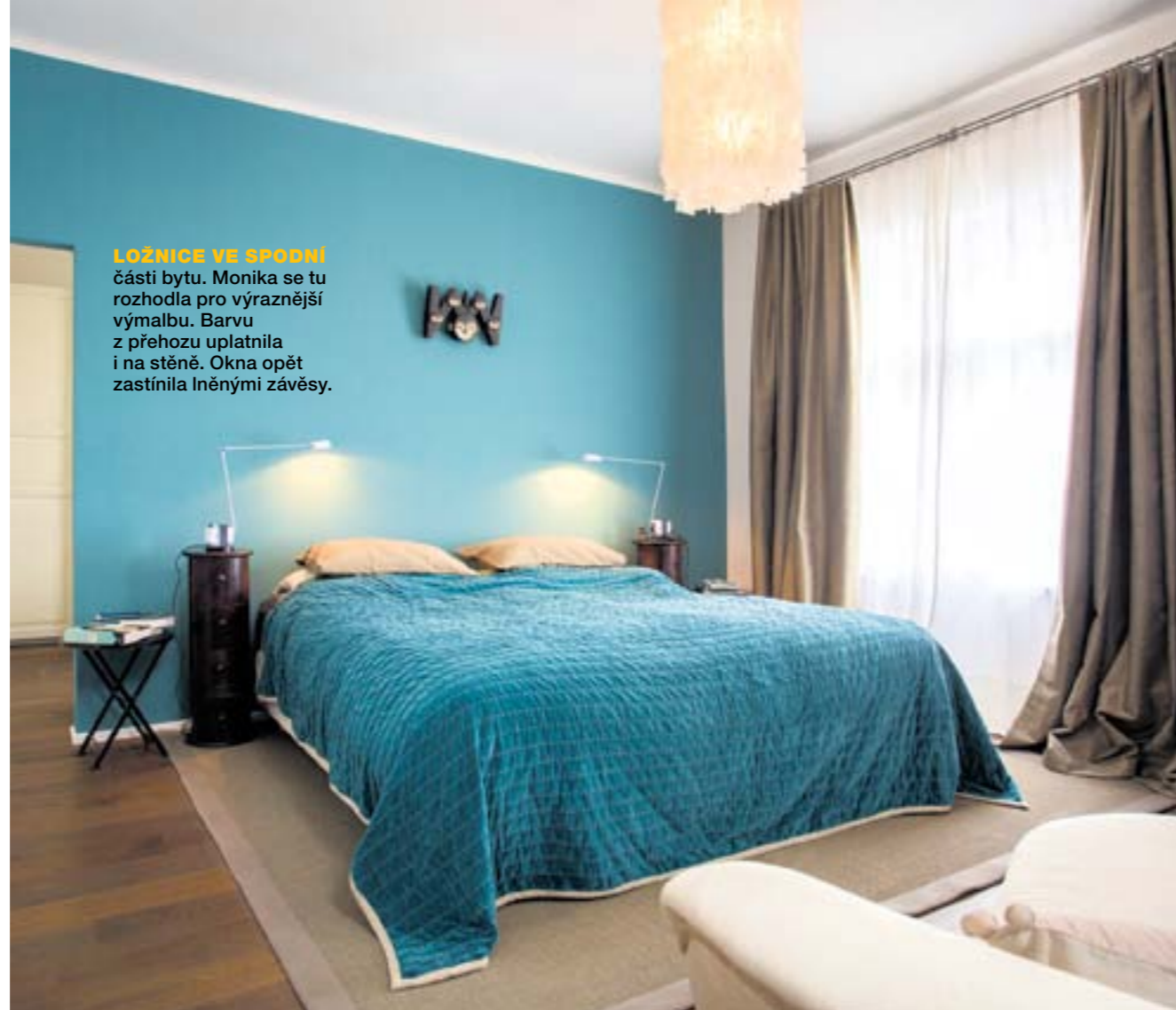
LOŽNICE VE SPODNÍ části bytu. Monika se tu rozhodla pro výraznější výmalbu. Barvu z přehozy uplatnila i na stěně. Okna opět zastínila lněnými závěsy.