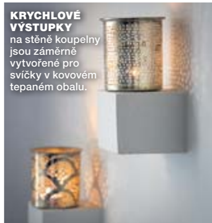
KRYCHLOVÉ VÝSTUPKY na stěně koupelny jsou záměrně vytvořené pro svíčky v kovovém tepaném obalu.